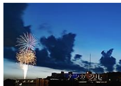
2021年6月29日「ナツガクル」 ※地元有志主催の花火打ち上げ