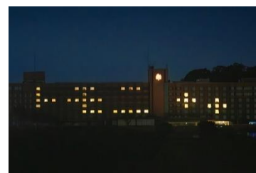
2024年2月20日・21日 「トモニ」

また、当ホテルでは世界自然遺産登録3周年を記念し、2024年7月5日(金)～7月31日(水)の期間、各レストランとショップで奄美群島フェアを開催いたします。今回は、ホテルの料理長たちが現地へ足を運び、食材や商品を厳選し、その持ち味を最大限に生かした料理の提供や特産品の販売をいたします。