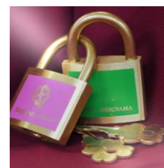
誓いのクローバーにける南京錠