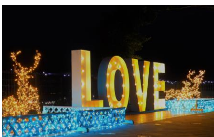
LOVE ジェニックサイト

昨年誕生したフォトスポット「LOVE ジェニックサイト」。LOVEの文字を象ったイルミネーションは高さ150cmで迫力大。鹿児島市街地の夜景をバックに、映画のワンシーンのような愛あふれる1枚が撮影できます。永久に「幸せ」が続くようにと願いを込め、南京錠をかける「誓いのクローバー」もあり、大切な人との絆が深められるスポットです。